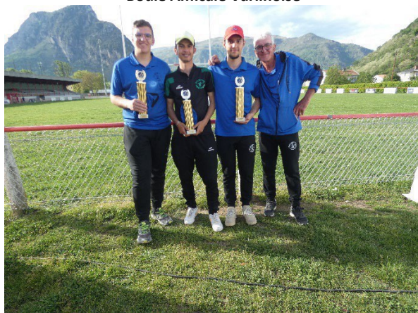
Champions de l'Ariège Triplettes Juniors 2024 Boule Lézatnoise Pétanque Escosse Pétanque