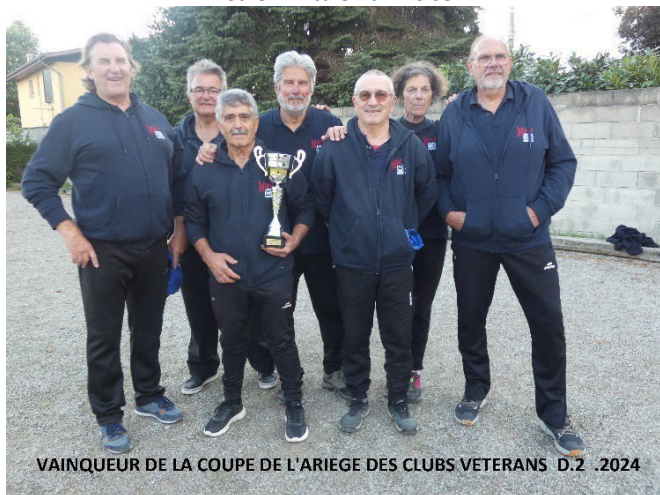
VAINQUEUR DE LA COUPE DE L'ARIEGE DES CLUBS VETERANS D.2 .2024