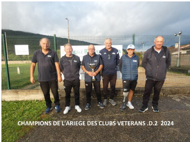
CHAMPIONS DE L'ARIEGE DES CLUBS VETERANS .D.2 2024