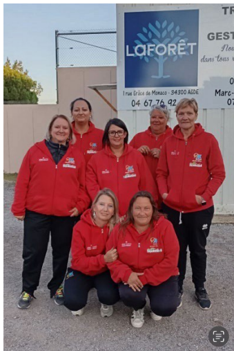
Pétanque Axéenne ¼ Finaliste CRC Féminin 2024