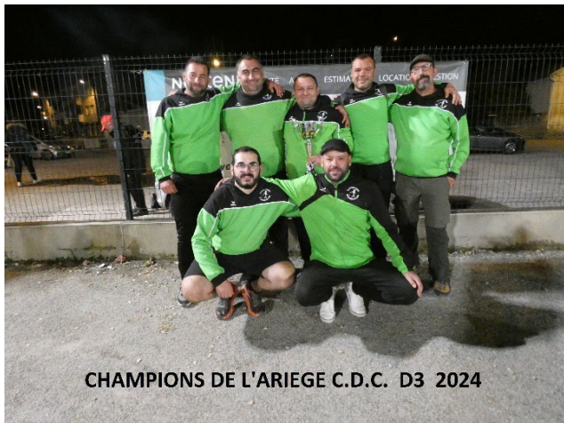
CHAMPIONS DE L'ARIEGE C.D.C. D3 2024