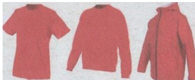
Hauts demême couleurs et demême conception