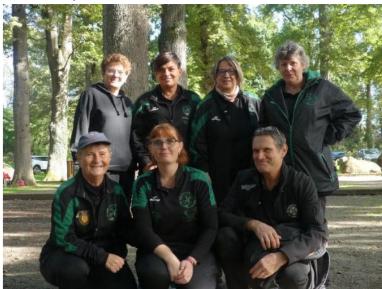
Pétanque Club Saint Girons Couserans ¼ Finaliste CRC Féminin 2024