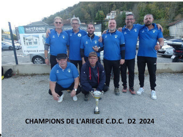
CHAMPIONS DE L'ARIEGE C.D.C. D2 2024