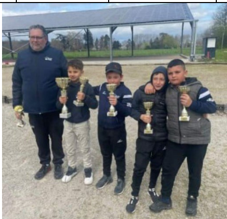
CDC Minimes champions de l'Ariège 2024 Boule Amicale Varilhoise