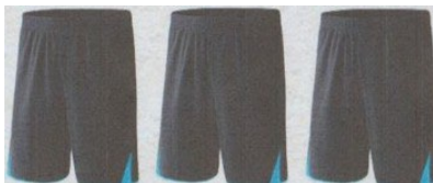
Modèle et couleur identiques