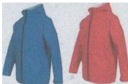
Haut de couleur différente