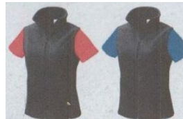
Manches decouleurs différentes