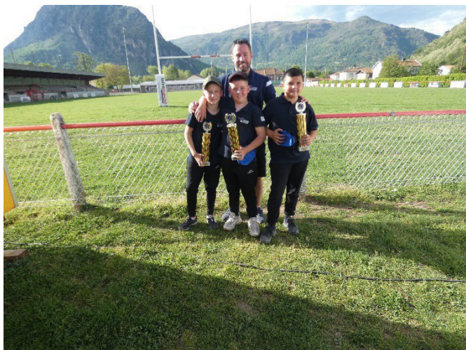
Champions de l'Ariège triplettes Minimés 2024 Boule Amicale Varilloise