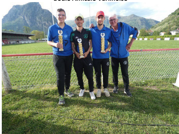
Champions de l'Ariège Triplettes Juniors 2024 Boule Lézatôise Pétanque Escosse Pétanque