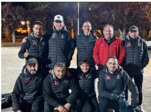
Pétanque Tarasconnaise 2ème tour régional Coupe de France des clubs