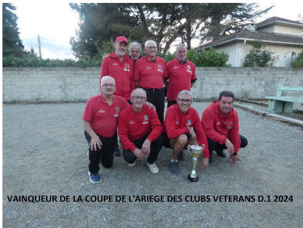
VAINQUEUR DE LA COUPE DE L'ARIEGE DES CLUBS VETERANS D.1 2024

Jeudi 9 Octobre 2025 Finale Coupe ariège D1 et D2