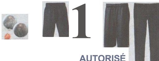
Modèle et couleur identiques