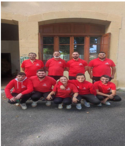
Cochonnet Aventésien 2eme tour régional Coupe de France des clubs